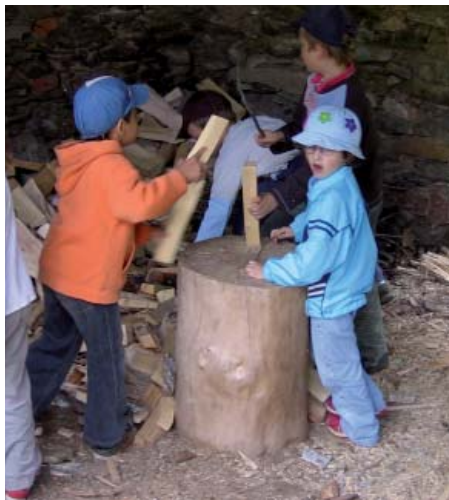
samozřejmě bez sekyrek

Maminky se nemusejí obávat, děti samozřejmě vychutnávají daleko prostší